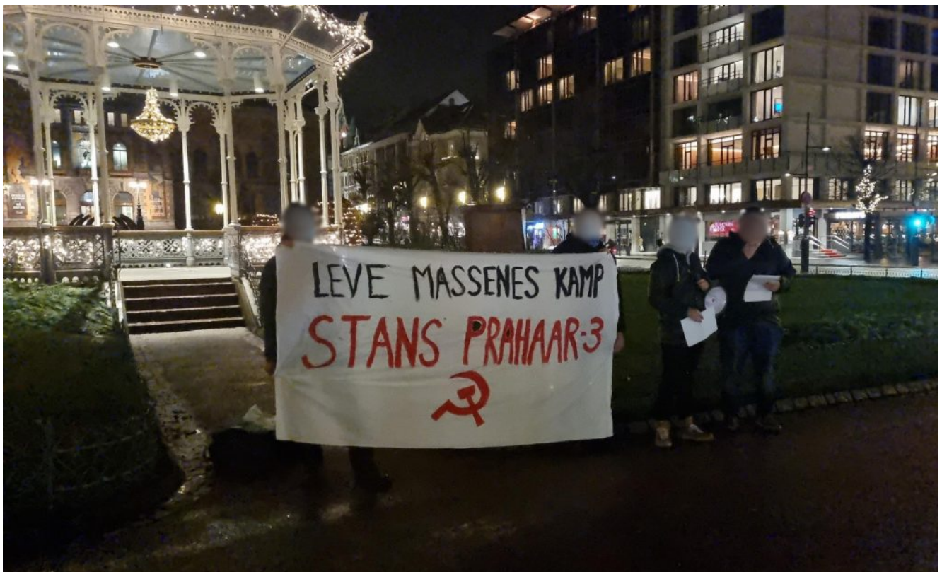
Demonstrasjon ved Musikkpaviljongen i Bergen. / Demonstration